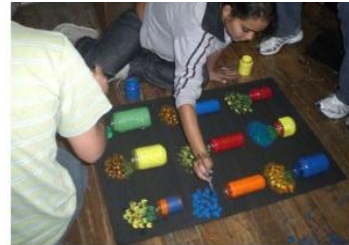
Pintura da reutilização dos vidros