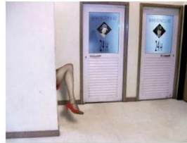
Exemplos de intervenção perna Daspu