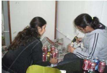
Montagem das latinhas

ver, não quer dizer que não exista um futuro". No dia seguinte, as esculturas foram reveladas, e cada uma apresentava um texto explicativo sobre o material de que ela era feita. O processo de produção está retratado nas fotos do nosso portfólio abaixo e que podem ser encontradas também no nosso site, www.lupa.eco.ufrj.br :