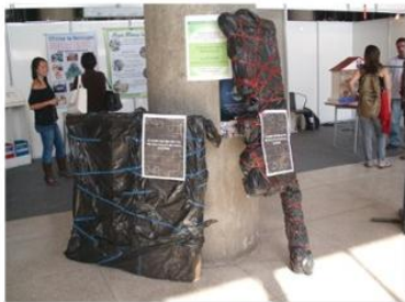
Exposição do formato