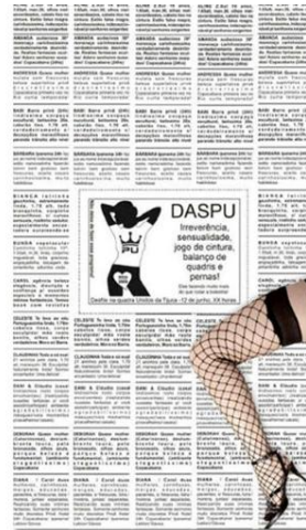
Além da intervenção foram feitos também flyers para divulgação da marca

Com objetivo de apoiar regimes de visibilidade de projetos de minorias culturais, o LUPA desenvolveu toda a ação comunicativa do Entlaid's, 16º Encontro de Travestis e Transexuais: todo o material gráfico do evento ( banners, flyers, folders, crachás, convites, certificados ). O banner a seguir revela a linha criativa adotada na divulgação desse Encontro realizado no Rio de Janeiro em 2009: