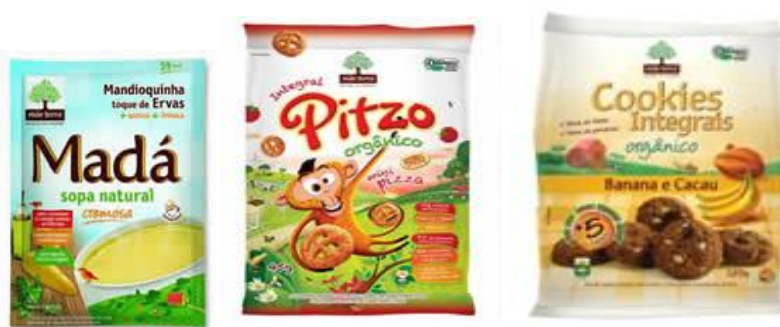
Fig. 3 - Embalagens de produtos ultraprocessados Mãe Terra: sopa, salgadinhos e cookies .

As embalagens dos alimentos ultraprocessados, reproduzidas na Figura 3, apresentam um padrão visual bastante diferente do dos alimentos minimamente processados. A ilustração da casa no campo, presente na largura inteira do rodapé de todas as embalagens dos grãos integrais, aparece em metade do rodapé da sopa; como pano de fundo e diluída pela presença de outros elementos chamativos (como o macaco) na embalagem de salgadinho; apenas evocada pelo desenho de algumas montanhas na parte